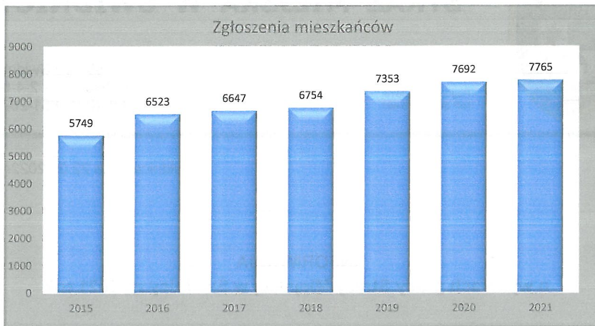
Wykres 1. Ilość zgłoszeń wpływająca od mieszkańców do Straży Miejskiej w Świdnicy w latach 2015-2021

Sprawozdanie z realizacji ustawowych zadań przez Straż Miejską w Świdnicy w 2021 roku przedstawiono w pięciu działach: